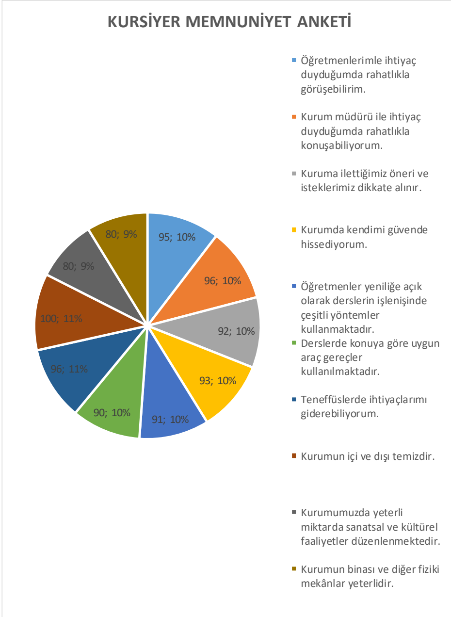
Şekil 2: Kursiyer değerlendirme durumu